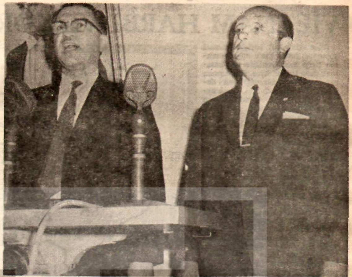
Irak Başbakanı Bazzaz ve Süleyman Demirel Barzani üzerine hasbihal..

Bazzaz'ın ziyaretinden birkaç gün önce de, Millî İstihbarat Teşkilâtı Müsteşar Vekili Fuat Doğu'nun başkanlığında, Marmara Köşkünde 21 müsteşarın katıldığı bir