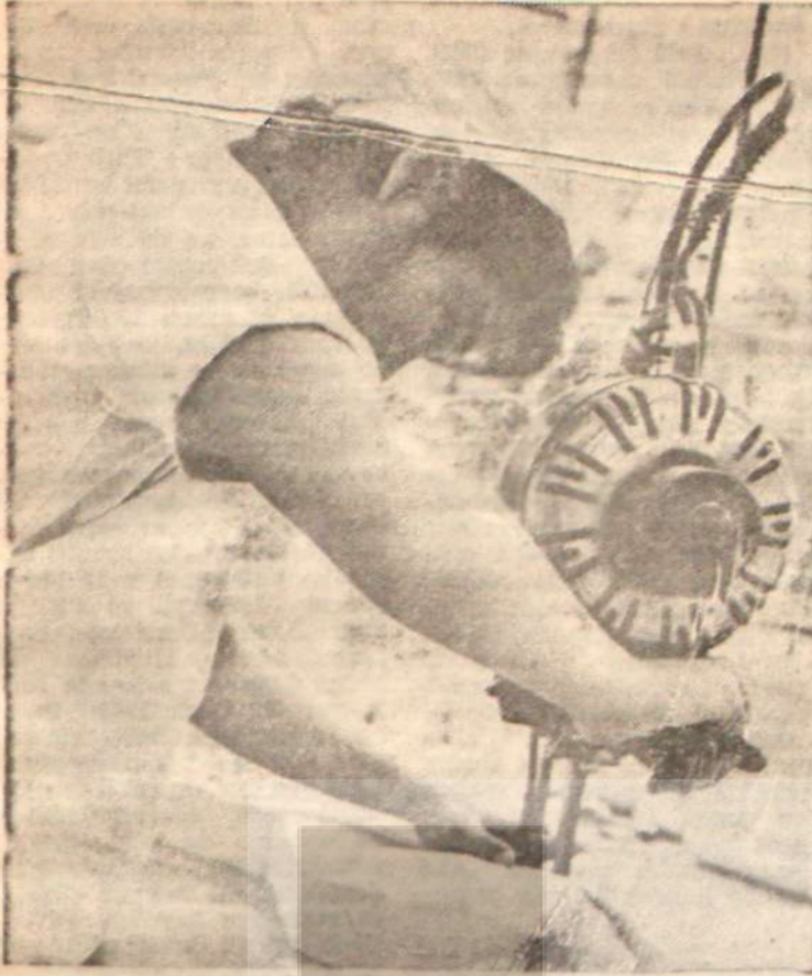
«Yeni Çin kadını» tezgâh başında